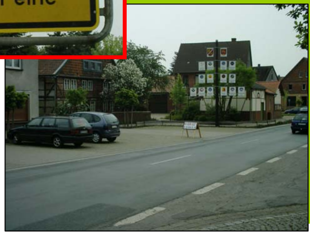
Erneuerung der Dorfmitte