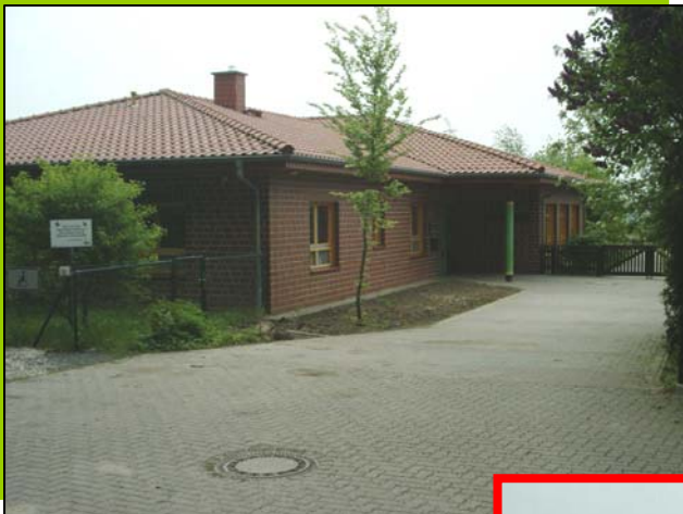
Kindergarten im Grünen