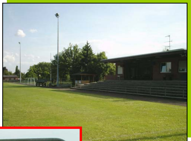
Sport- und Freizeitanlage